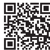
掃描二維碼查閱「2026香港綠色周」詳情