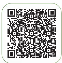
掃描二維碼登入問卷