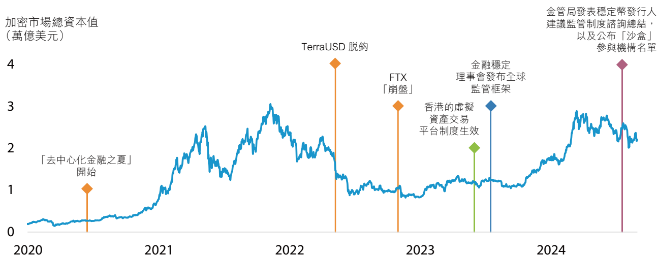
圖表 1 加密資產市場發生的主要事件

同時，香港的公營與私營部門一直研究不同形式的代幣化貨幣，以便與傳統形式的貨幣互相補足，當中包括央行數碼貨幣以及私營部門發行的代幣化貨幣即穩定幣，而金管局正着手為後者制定穩定幣發行人監管制度。金管局又在2024年7月推出「沙盒」，以便向計劃在香港發行穩定幣的機構傳達監管期望，以及讓參與機構在有限範圍和風險可控的情況下測試其預期用例。