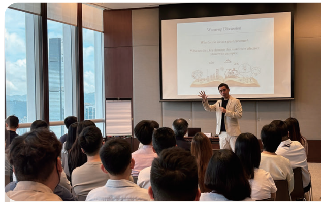
為高級經理舉辦簡報演講技巧工作坊