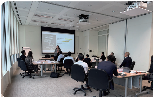
為分處主管舉辦績效評估關鍵對話工作坊