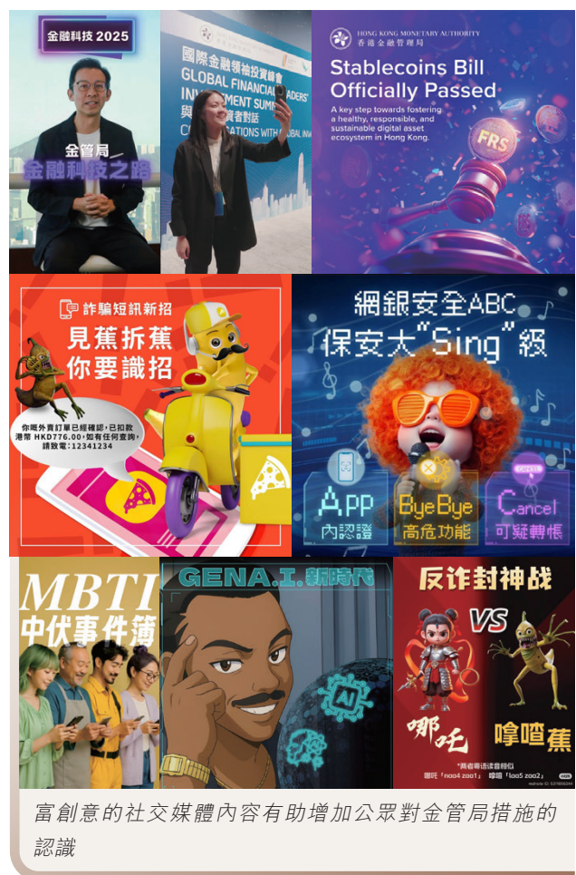
富創意的社交媒體內容有助增加公眾對金管局措施的認識

金管局利用生成式人工智能等最新技術，以具吸引力的故事敘述法創作社交媒體內容。一方面向專業群體傳遞深入的分析，另一方面結合流行元素，為公眾製作生動有趣的短片及其他多元化內容。這種按受眾群體需要的分層內容的策略，更有效傳遞金管局各項措施的訊息。