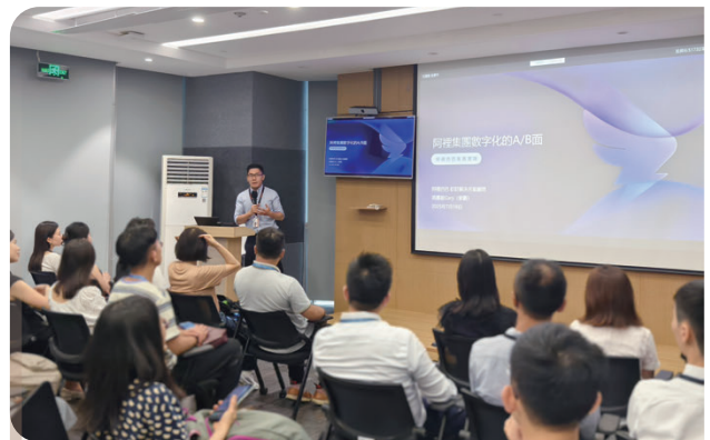
為經理舉辦大灣區考察團