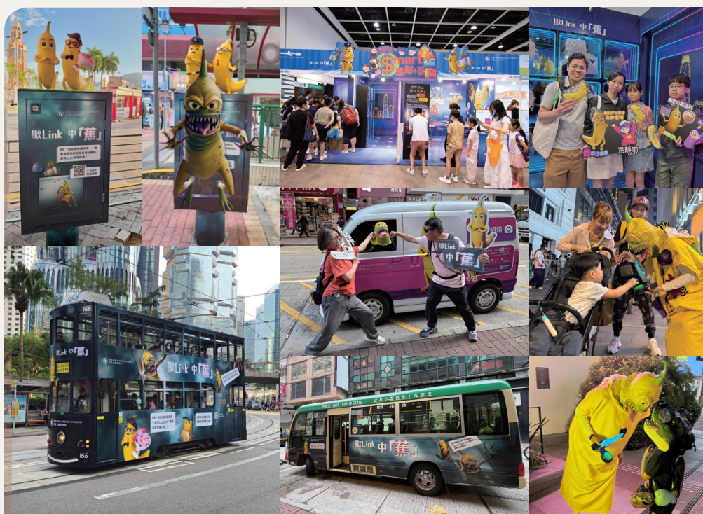
「噏啗蕉」成功引起市民關注，有助防騙訊息在社區廣傳

金管局在2025年推出原創角色「噏啗蕉」，以這卡通人物代表百變騙徒，提醒公眾「Link一揪錯，『蕉』來橫禍」，要時刻慎防點擊可疑連結。透過跨媒體推廣，活動有效提高公眾對相關騙案的防範意識。