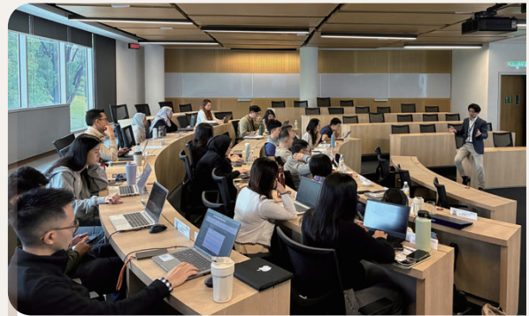
見習經理及見習經濟師參與海外中央銀行課程

我們設有夏季及冬季實習計劃，為大學本科生提供機會，體驗中央銀行的實際工作環境及了解其擔當的角色。實習計劃內容包括為實習生安排講座及參觀活動，讓他們深入了解金管局的職能及工作。