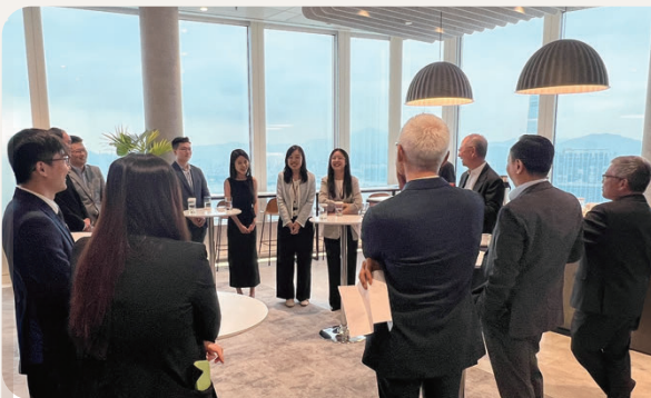
見習經理及見習經濟師與高層人員交談互動