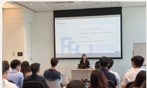
夏季實習生參與認識金融科技講座