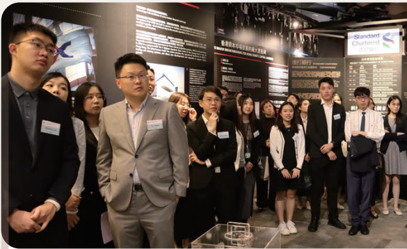
見習經理及見習經濟師參與就業網絡交流會

助理經理是金管局專業員工團隊的重要骨幹。大部分助理經理獲派往與負責監管銀行業務有關的部門，參與維繫香港銀行體系安全穩定的工作，亦有部分負責其他職能範疇，協助分析及提供其他形式的支援。對於有志投身銀行監理及規管工作的大學畢業生來說，助理經理是理想的起步點。