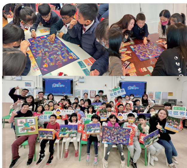
試玩活動向教師、學童及家長推廣桌上理財教育遊戲

我們繼續運用得獎理財教育桌上遊戲《Smart理財321》向年輕人推廣金融知識。我們在社區中心及小學舉辦試玩工作坊，並透過教師培訓工作坊，鼓勵中學教師將該桌遊作為初中科目「公民、經濟與社會」的教學工具。我們在2025年共舉辦了33場工作坊，吸引超過3,000名學生、家長、教師及社工參與。