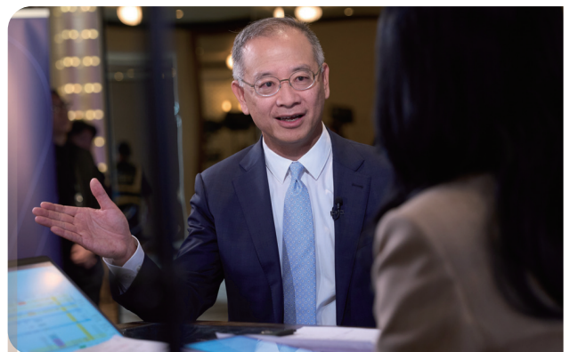
總裁余偉文先生於「國際金融領袖投資峰會2025」接受媒體直播訪問

在2025年，傳媒代表積極參與金管局舉辦的活動，尤其是「國際金融領袖投資峰會」。為期三日的峰會，獲得本地、中國內地及國際媒體3,700多篇新聞報道。