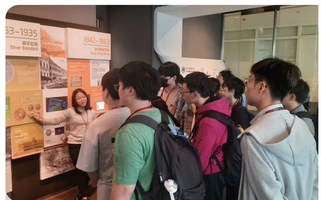
中學生參加資訊中心導賞，認識香港的貨幣、金融和銀行體系發展史