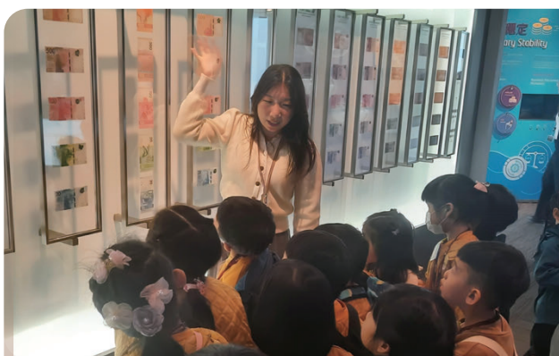
資訊中心導賞員向幼稚園學生介紹香港鈔票的設計

年內資訊中心接待超過85,000名訪客，亦為學校及其他團體提供540多次導賞服務。