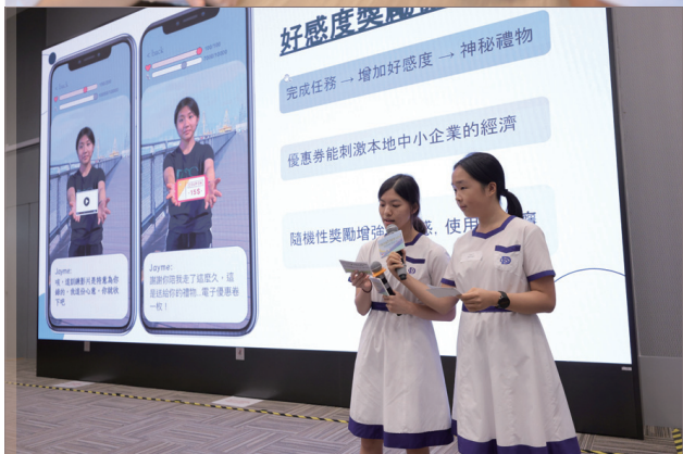
參與「少年金融人才計劃」的學生從導師身上獲益良多，為「設計思維挑戰賽」作準備