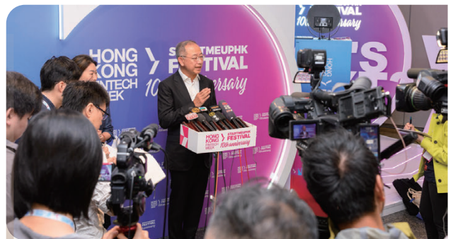
總裁余偉文先生於「香港金融科技周2025」接受媒體即場訪問