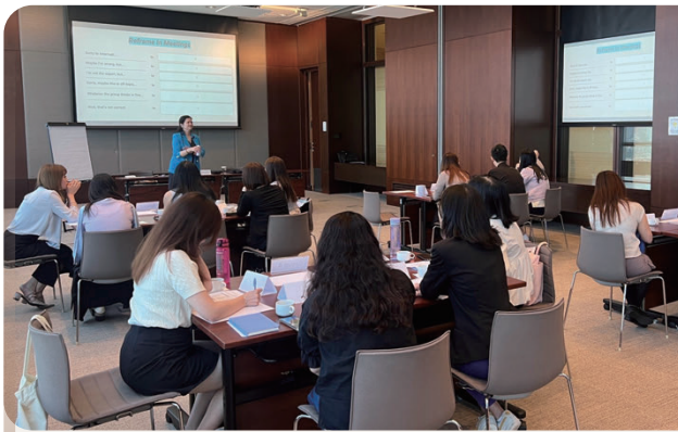
為員工舉辦自信溝通工作坊

金管局非常重視發展員工的專業能力，以配合機構需要及促進員工自身發展，從而亦能提升員工應對新挑戰的能力。我們按各職級員工的需要而制定有系統的培訓課程，並投入適當資源提供配合職位的縱向培訓，以及有關一般課題的橫向培訓。我們為員工舉辦與機構的主要工作重點及新趨勢相關的專題講座，涵蓋「金融科技2030」、可持續投資及人民幣國際化等課題，使員工能掌握金融事務的最新發展。我們又舉辦高層人員領導才能培訓課程，向他們傳遞有效帶領機構的技能及心得。此外，我們在2025年亦舉辦考察團，加強員工對粵港澳大灣區（大灣區）最新發展的了解。