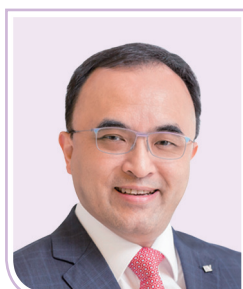
陳凱先生 , JP 安永中國主席 安永大中華區首席執行官