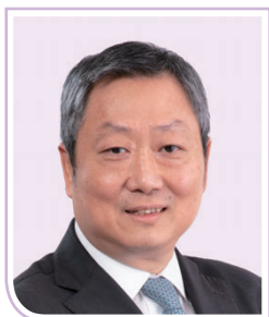
黃天祐博士, SBS, JP 證券及期貨事務監察委員會 主席 (委員任期由2025年10月10日起)