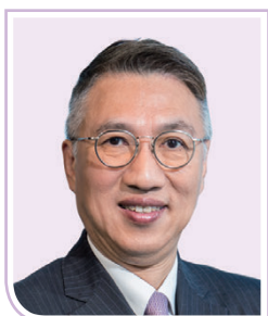
周志賢先生 德勤亞太主席 德勤全球副主席