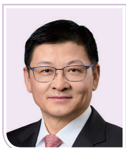
孫煜先生, JP 中國銀行(香港)有限公司 副董事長兼總裁