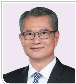
陳茂波先生, 大紫荊勳賢, GBS, MH, JP 財政司司長