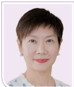
張穎嫻女士 畢馬威中國副主席 畢馬威香港區首席合夥人 (委員任期由2025年10月10日起)