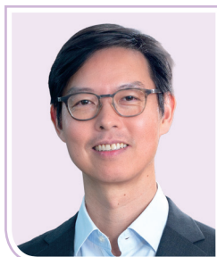
廖宜建先生 , JP 滙豐控股有限公司 亞洲及中東地區聯席行政總裁