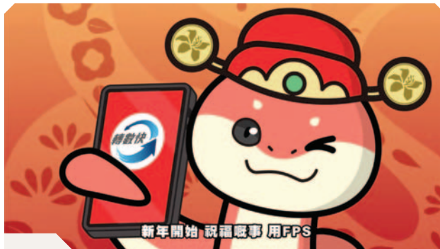
製作動畫短片鼓勵派發電子利是

為配合數碼支付及綠色生活的趨勢，我們透過社交媒體及電台宣傳，鼓勵市民於農曆新年期間派發電子利是，亦可考慮以「迎新鈔」派發實體利是。