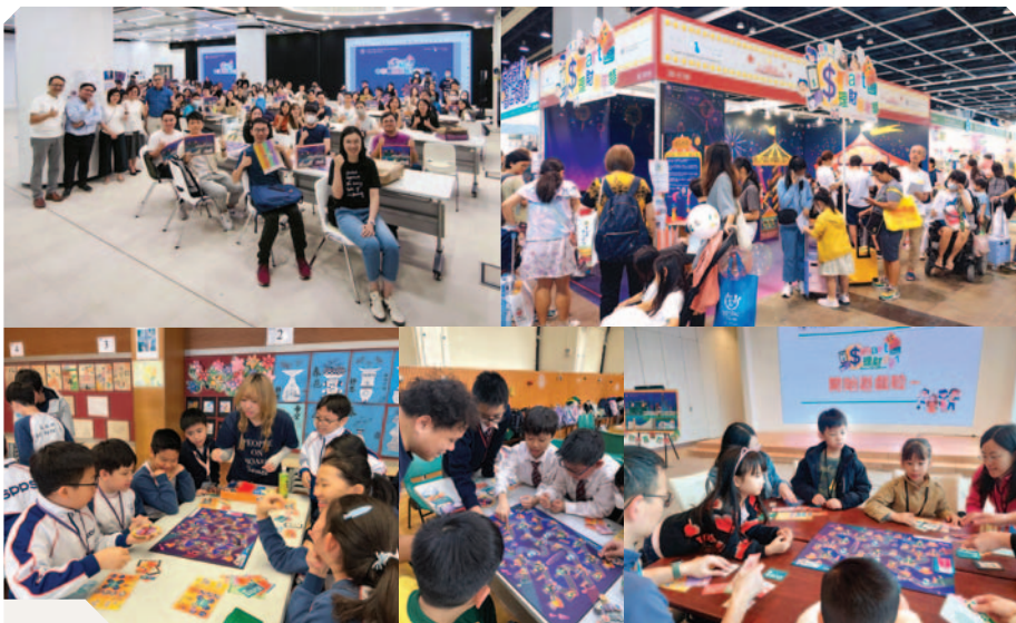
透過桌遊活動向教師、學童及家長推廣理財教育

此外，我們繼續支持投資者及理財教育委員會的工作，提升香港市民的金融知識及理財能力，並會研究與不同持份者進一步合作，提高社區參與工作的成效。