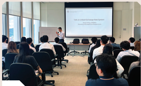
夏季實習生參與認識聯繫匯率制度講座