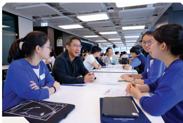
參與「少年金融人才計劃」的學生與導師會面