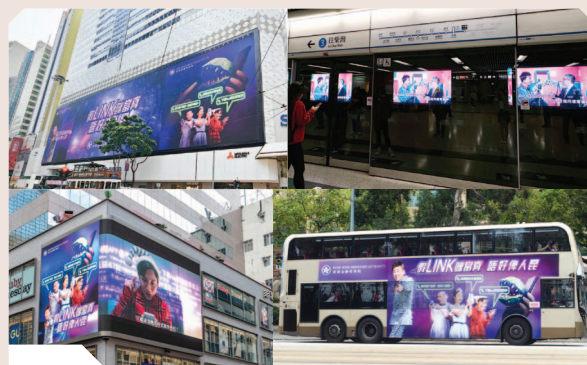
跨媒體宣傳活動加強公眾防騙意識