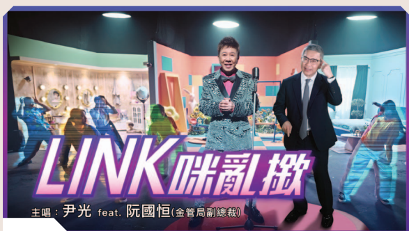
副總裁阮國恒先生(右)參與演繹防騙歌曲

為進一步加強防騙工作，我們推出由歌手尹光先生與金管局副總裁阮國恒先生合唱的防騙歌曲，提醒市民「假Link咪當真，唔好俾人毘」，以及要妥善保管敏感的個人資料與信用卡資料。跨媒體宣傳活動的成效得到肯定，取得國際推廣殊榮。