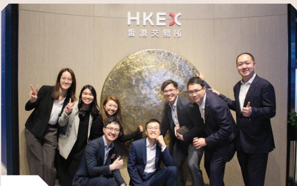
見習經理及見習經濟師參觀香港交易所