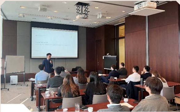
見習經理及見習經濟師參與數碼智能分享會

助理經理是金管局專業員工團隊的重要骨幹。大部分助理經理獲派往與負責監管銀行業務有關的部門，參與維繫香港銀行體系安全穩定的工作，亦有部分負責其他職能範疇，協助分析及提供其他形式的支援。對於有志投身銀行監理及規管工作的大學畢業生來說，助理經理是理想的起步點。