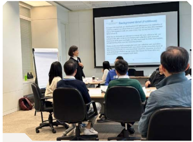
為高級經理舉辦引導技巧工作坊