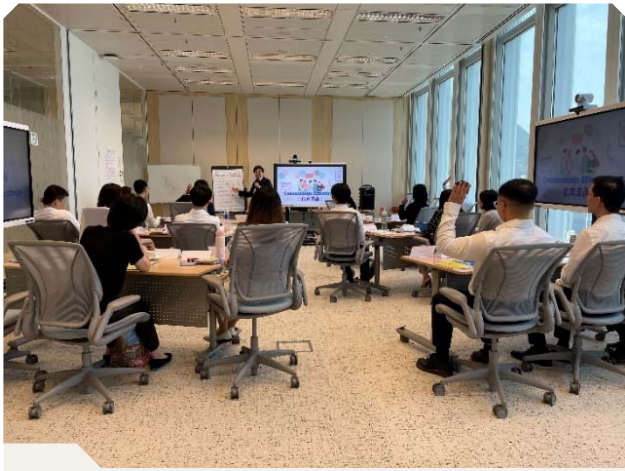
為員工舉辦團隊建立與協作工作坊

金管局非常重視發展員工的專業能力，以配合機構的運作需要及促進員工事業發展，從而亦能提升員工應對新挑戰的能力。我們按照個別員工及機構的需要，投入適當資源提供配合職位的縱向培訓，以及有關一般課題的橫向培訓。在2024年，我們繼續推出有系統的培訓課程，因應員工工作及職級提升其專業發展。我們為員工舉辦與我們的主要工作重點及新趨勢相關的專題講座，涵蓋可持續投資、氣候變化及金融穩定等課題，以使員工能掌握金融事務的最新發展，並支援不同職能範疇。我們又舉辦高層人員領導才能培訓課程，向他們傳遞有效帶領機構的技能及心得。