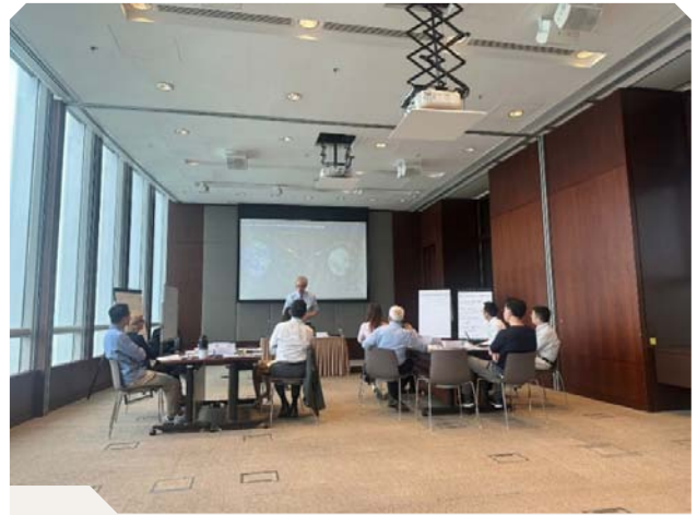
為部門主管舉辦情緒智商與領導能力工作坊