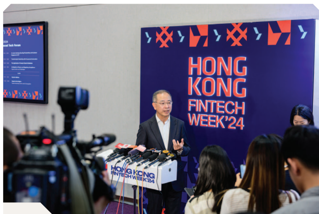
總裁余偉文先生於「香港金融科技周2024」接受媒體即場訪問

金管局與傳媒保持緊密聯繫，以提高透明度及增進公眾對其政策及運作的了解。金管局在2024年共舉辦或參與207次活動，包括14次新聞發布會、四次傳媒簡報會、14次即場訪問及175次其他公開活動。為增進社會對金管局主要職能的認識，金管局為本地、內地及境外的媒體舉辦新聞發布會及傳媒簡報會，涵蓋代幣化、防騙措施及支援中小企措施等主題。年內金管局亦安排25次媒體訪談、發布約600份雙語新聞稿，並處理大量傳媒日常查詢。