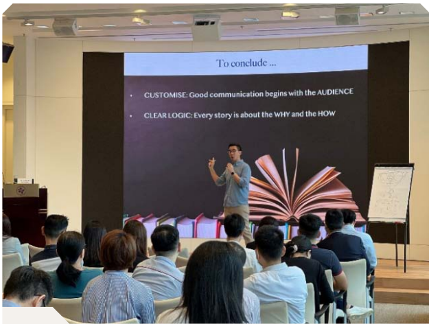
為經理級別員工舉辦一系列簡報演講技巧講座