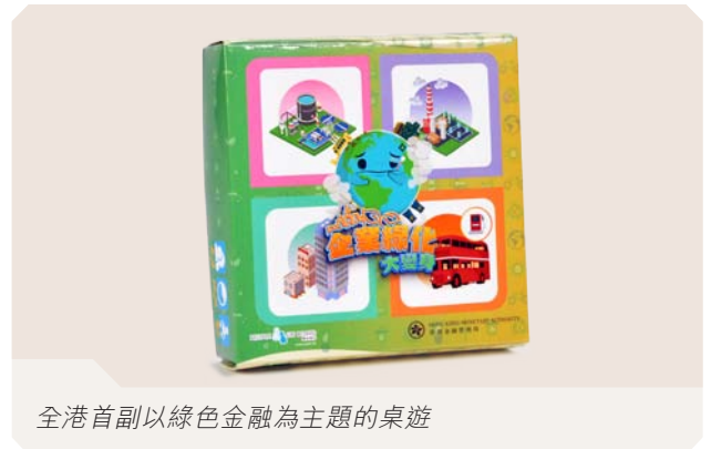
全港首副以綠色金融為主題的桌遊

在開發《Smart理財321》桌遊的經驗基礎上，金管局推出策略桌遊《企業綠化大變身》，於「香港書展2024」的攤位作為紀念品送出。這是全港首副向學生傳遞綠色金融知識的桌遊。