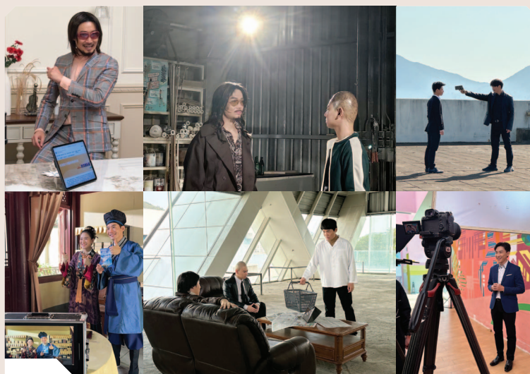
短片以風趣幽默的方式介紹「跨境理財通」

金管局與一間本地電視台聯合製作《跨境理財新機遇》電視短片系列，協助市民進一步了解「粵港澳大灣區跨境理財通」（「跨境理財通」）為零售投資者在跨境投資上帶來的機遇及便利。這短片系列藉五部膾炙人口的港產電影的「經典場面」，解說「跨境理財通」的框架、投資者的資格要求、「北向通」與「南向通」提供的產品、風險管理，以及跨境投資應注意的事項，並透過電視、數碼及社交媒體平台進行推廣。