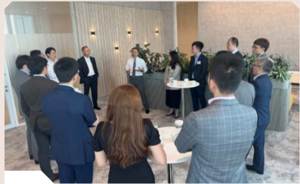
見習經理及見習經濟師與高層人員交談互動

我們設有夏季及冬季實習計劃，為大學本科生提供機會，體驗中央銀行的實際工作環境及了解其擔當的角色。實習計劃內容包括為實習生安排講座及參觀活動，讓他們深入了解金管局的職能及工作。