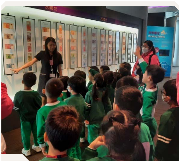
幼稚園生參加資訊中心導賞，認識有關香港鈔票的設計