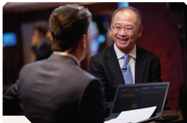
總裁余偉文先生於「國際金融領袖投資峰會2024」接受媒體直播訪問

傳媒代表積極參與金管局在2024年舉辦的活動，尤其是第三屆「國際金融領袖投資峰會」。峰會為期三日，獲得本地、內地及國際媒體逾萬篇新聞報道。