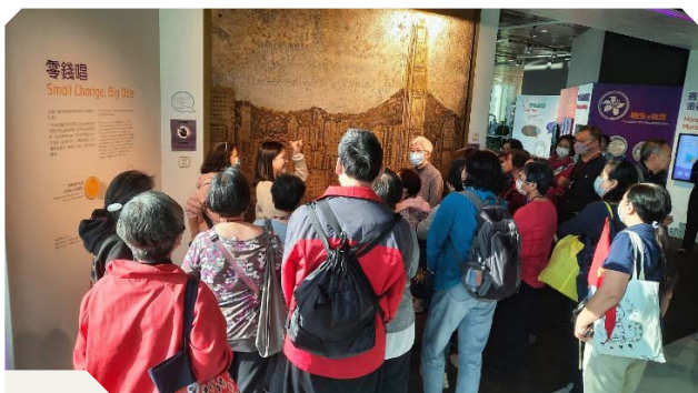
資訊中心人員向訪客介紹以香港硬幣砌出維港景色的馬賽克作品