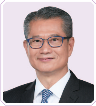
陳茂波先生, 大紫荊勳賢, GBS, MH, JP 財政司司長