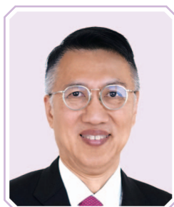
周志賢先生 德勤亞太主席 德勤全球副主席 (任期由2024年7月15日起)