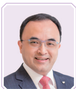
陳凱先生, JP 安永中國主席 安永大中華區首席執行官 (任期由2024年3月1日起)