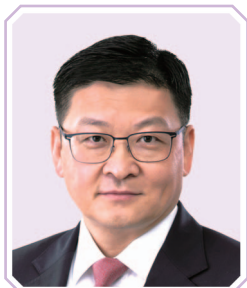
孫煜先生, JP 中國銀行(香港)有限公司 副董事長兼總裁