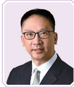
袁國強資深大律師, 大紫荊勳賢, JP 大律師事務所 (任期至2024年8月31日止)