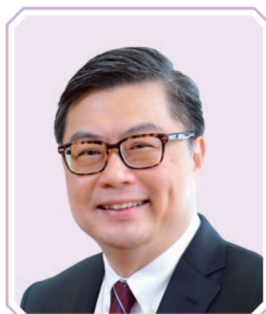
譚嘉因教授, MH, JP 香港科技大學 副校長(行政)及講座教授