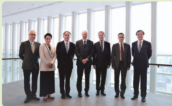
金管局舉辦督導小組成立大會，金管局總裁余偉文先生(右三)為該小組的聯席主席。

督導小組在12月發布綠色及可持續金融策略，提出從六方面鞏固香港金融生態系統，長遠共建更綠色及更可持續的未來。督導小組亦宣布5個短期行動綱領，處理發展過程中一些最迫切的問題。