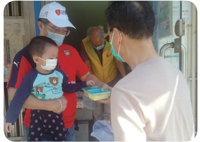
金管局員工及家人參與榕光社舉辦的「惠膳行動」。

鑑於2020年疫情反覆，許多義工活動均告暫停或取消。然而，金管局員工繼續參與賣旗活動、「綠色低碳日」、「公益愛牙日」、「公益行善『折』食日」、「公益金便服日」及「愛『飾』動物日」，又參與定期回收活動，將衣物、玩具及其他可重用物品轉贈慈善團體。