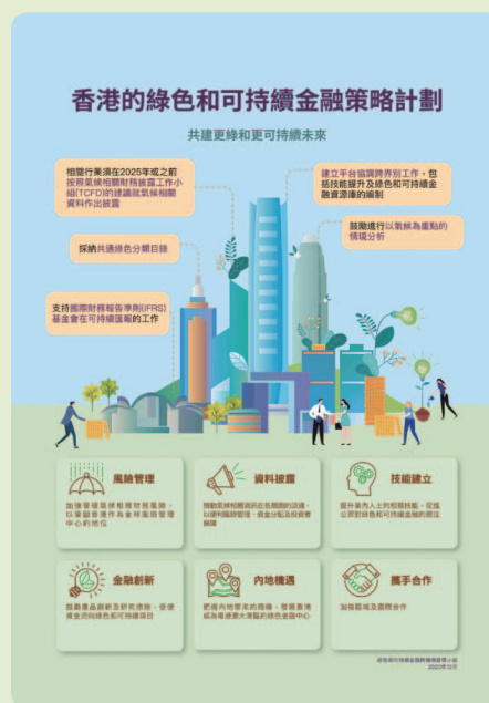
督導小組發布香港的綠色和可持續金融策略計劃及5個主要行動綱領。