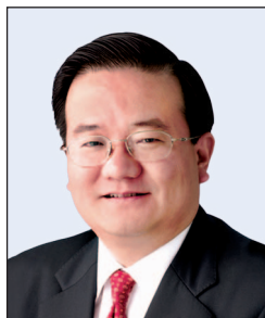
高迎欣先生 , JP 中國銀行(香港)有限公司 副董事長兼總裁 (任期至2020年5月24日止)