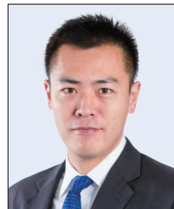
劉鳴煒先生 , GBS, JP 華人置業集團 主席