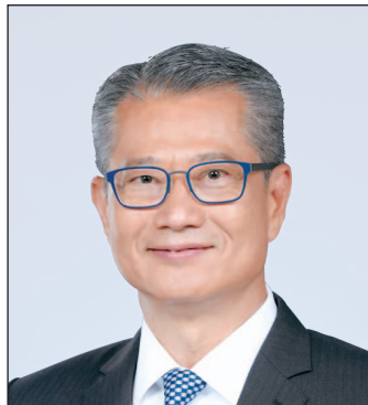
陳茂波先生, 大紫荊勳賢, GBS, MH, JP 財政司司長