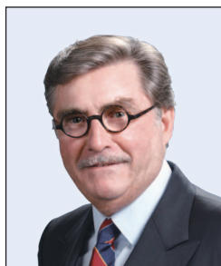
施文信先生 , GBS, JP (任期至2020年1月31日止)