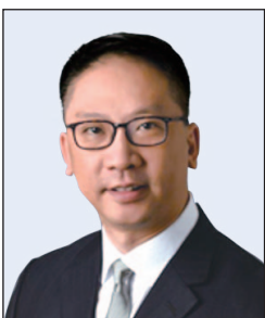
袁國強資深大律師 , 大紫荊勳賢, JP 大律師事務所