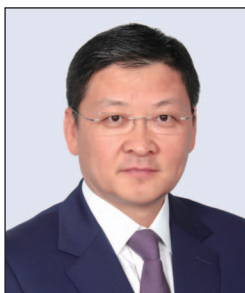
孫煜先生 中國銀行(香港)有限公司 副董事長兼總裁 (任期由2021年3月15日起)