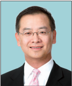
余偉文先生, JP 金融管理專員 (任期由2019年10月1日起)