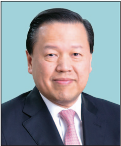
雷添良先生，SBS, JP 證券及期貨事務監察委員會 主席 (任期由2019年7月1日起)