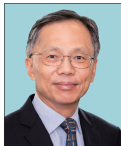
羅家駿先生, SBS, JP