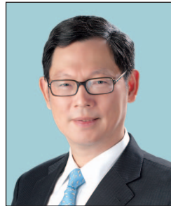
陳德霖先生, GBS, JP 金融管理專員 (任期至2019年9月30日止)