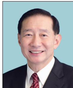
王冬勝先生, JP 香港上海滙豐銀行有限公司 副主席兼行政總裁