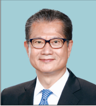
陳茂波先生, 大紫荊勳賢, GBS, MH, JP 財政司司長