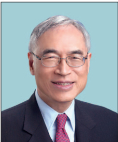
劉遵義教授，GBS, JP 香港中文大學 藍饒富暨藍凱麗經濟學講座教授 (任期至2019年9月30日止)