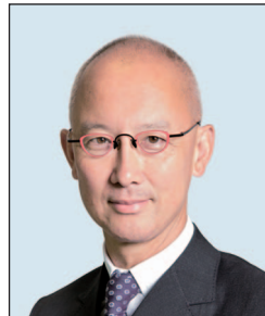
蔡永忠先生 , BBS, JP 德勤中國 主席 (任期至2018年8月31日止)