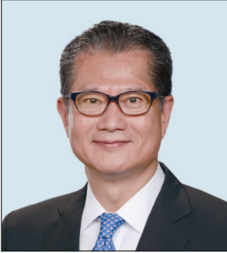
陳茂波先生，大紫荊勳賢，GBS, MH, JP 財政司司長