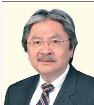
曾俊華先生, GBM, JP 財政司司長 (任期至2017年1月15日止)