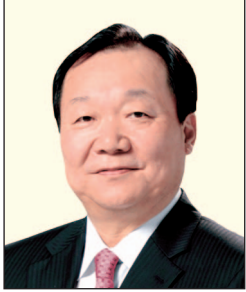
岳毅先生 中國銀行(香港)有限公司 副董事長兼總裁