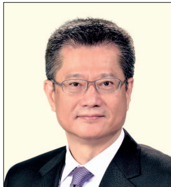
陳茂波先生, GBS, MH, JP 財政司司長 (任期由2017年1月16日起)