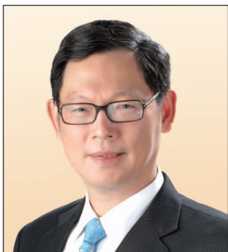
陳德霖, GBS, JP 總裁