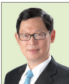
陳德霖先生, GBS, JP 金融管理專員