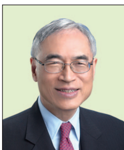
劉遵義教授, GBS, JP 中投國際(香港)有限公司董事長 香港中文大學藍饒富暨藍凱麗經濟學講座教授