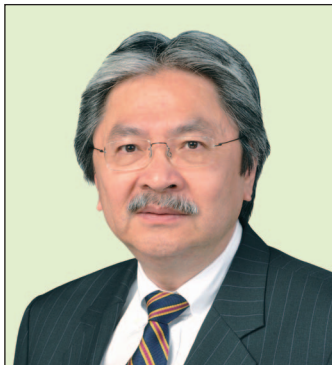
曾俊華先生, GBM, JP 財政司司長