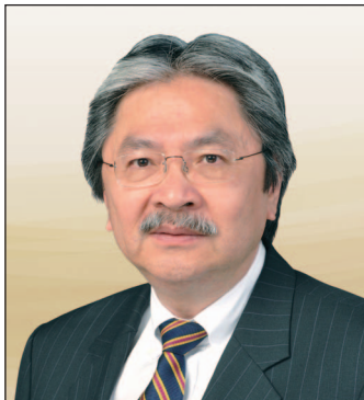
曾俊華先生, GBM, JP 財政司司長