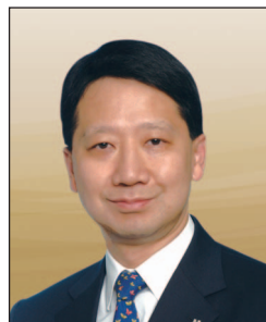
彭耀佳先生, SBS, JP 置地控股有限公司 總裁