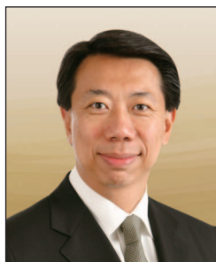
洪丕正先生, JP 渣打銀行(香港)有限公司 執行董事及行政總裁