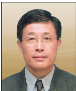
馮鈺斌博士, JP 永亨銀行有限公司 董事長兼行政總裁 (任期至2012年10月2日止)