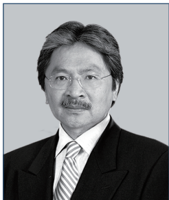
曾俊華先生, JP 財政司司長