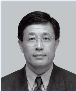
馮鈺斌博士 , JP 永亨銀行有限公司 董事長兼行政總裁