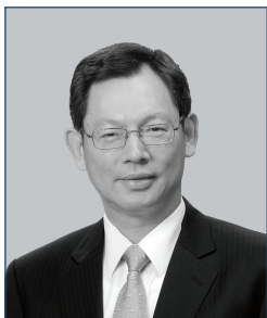
陳德霖先生, SBS, JP 金融管理專員 (任期由2009年10月1日起)