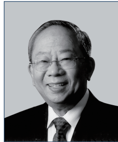
陳祖澤先生 , GBS, JP 香港賽馬會 主席