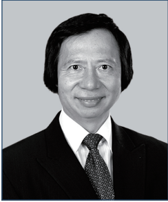
郭炳江先生 , SBS, JP 新鴻基地產發展有限公司 副主席兼董事總經理