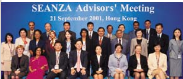
中央銀行代表出席金管局於2001年9月舉辦的東南亞與新西蘭及澳洲中央銀行組織顧問會議。

為掌握最新國際金融發展情況，金管局積極參與國際貨幣基金組織、國際結算銀行及亞洲開發銀行的活動。2001年9月，金管局與世界銀行及太平洋經濟合作理事會聯合舉辦東亞地區性金融合作研討會。約110位來自國際金融機構及私營部門的代表雲集香港，討論有關東亞債券市場發展及貨幣改革的課題。香港已同意於2002年參與基金組織的金融體系評估計劃。這個計劃有助香港找出金融體系存在的問題並採取補救措施，有利金融穩定。