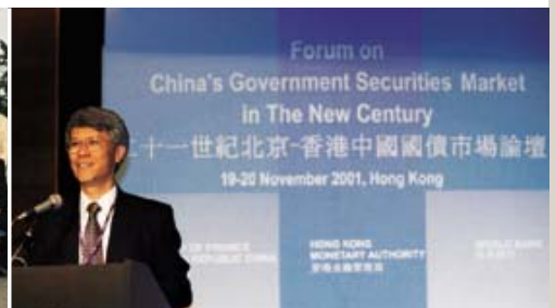
■ 總裁任志剛先生在金管局、中國財政部與世界銀行聯合舉辦的「二十一世紀北京-香港中國國債市場論壇」上發言。