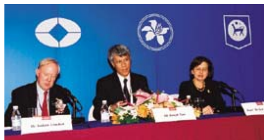
■ 金管局於2001年2月13日舉辦第4屆「卓越人士講座」。左起：國際結算銀行總經理Andrew Crockett先生、金管局總裁任志剛先生及馬來西亞中央銀行行長Zeti Akhtar Aziz博士。Andrew Crockett先生以「貨幣政策及金融穩定」為題發言。

金管局與內地有關當局保持緊密聯繫，以期能充分掌握與內地經濟日益融合，以及內地金融市場在中國加入世界貿易組織後進一步開放所帶來的機遇。這對香港繼續發展其作為中國的主要融資中心的地位相當重要。與此同時，金管局亦繼續在內地參與多項巡迴推介，並籌辦研討會、會議及其他有關活動，以推廣香港的金融服務。