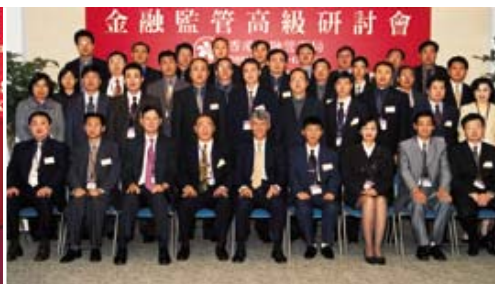
■ 金管局舉辦的第4屆中國人民銀行金融監管高級研討會。