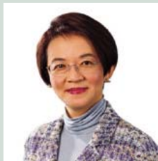
儲備管理部助理總裁 葉約德, BBS, JP

李令翔先生負責銀行業改革與拓展，以及發牌與電子銀行等特別環節的監管事務。李先生於1982年加入香港政府為政務主任，並於1990年出任首席助理金融司。李先生於1993年獲委任為金管局銀行業拓展處處長，並於1995年出任行政處處長。1996年，李先生獲擢升為銀行政策部助理總裁，並於2000年9月出任機構拓展及營運部助理總裁。李先生於2001年6月獲委任現職。