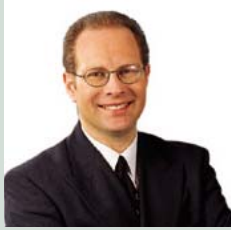
銀行政策部助理總裁 唐培新, JP

唐培新先生負責銀行業監管政策事宜。唐培新先生於1995年加入金管局為銀行監理部處長，並於2000年9月擢升至現職。在加入金管局前，唐培新先生曾先後於英倫銀行多個部門任職，亦曾於國際貨幣基金組織工作。