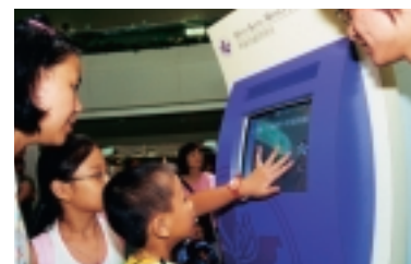
透過電腦問答遊戲加深對金管局工作的認識。

生及其他市民參觀。為配合展覽活動，金管局聯同香港電台第2台舉辦財經常識問答遊戲，並編製小冊子作為展覽場刊及紀念品。