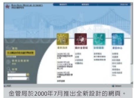
金管局於2000年7月推出全新設計的網頁。

2000年7月配合金管局展覽正式推出。全新網頁的優點包括網上導航更簡便、更迅速下載、精簡網頁結構、簡化網址、內容更充實、最新資訊訂戶電郵通知服務（截至2000年底，訂戶人數超過200名）。金管局網頁自1996年推出以來，已成為收集金管局資料最豐富及查閱方法最方便的資料庫（收集範圍包括舊有資料在內）。每周專欄《觀點》繼續在本港約10份報章上刊載，並在網上出版，成為表達意見、傳達訊息的寶貴園地。金管局網頁在2000年新增的內容包括新推出的銀行監管政策手冊、介紹香港國際金融中心的優勢的分頁、金管局展覽內容，以及千元鈔票新防偽特徵說明等。