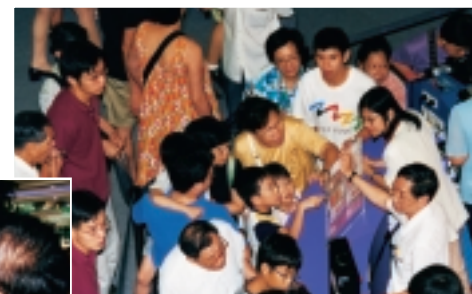
商業罪案調查科的攤位職員解釋真假鈔票的分別。