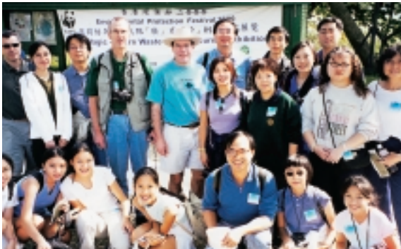
金管局職員聯同家人一起參加世界自然(香港)基金會於12月舉行的「米埔環保行」。

年內，金管局職員繼續參與各項社群活動，其中包括組隊參加2000年2月20日舉行的渣打香港馬拉松賽。2000年4月10日，金管局與香港紅十字會安排舉行捐血日，吸引49名職員參加捐血的善舉。全年共有超過300名職員參加公益金及其他慈善或公共機構舉辦的籌款活動。