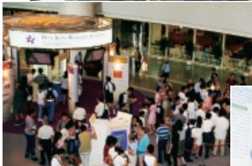
展覽於8月12日在金鐘太古廣場舉行。