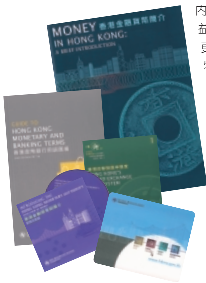
金管局教育資料組合包含的各款刊物及製品。

金管局在改善刊物的內容及設計上不斷精益求精，並讓市民更易於查閱這些刊物。金管局1999年《年報》在香港管理專業協會舉辦的最佳年報評選中獲得千禧獎，正是對我們善用網頁，方便市民查閱該年報的嘉許證明。