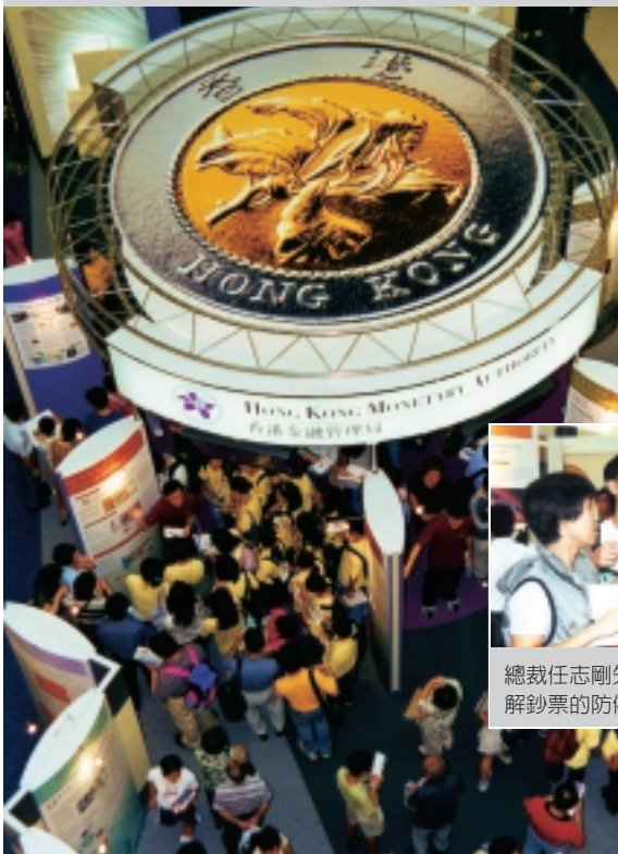
展覽於8月5日在九龍塘又一城舉行。