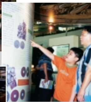
參觀者正在探討香港貨幣制度的歷史。