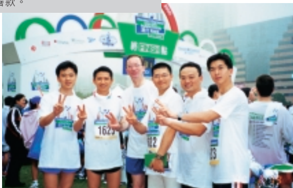
金管局職員組隊參加渣打銀行香港馬拉松賽。