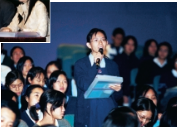
金管局在2000年舉辦8項教育研討會，吸引4,000多名學生、教師及社區組織成員參加。

在2000年，金管局舉辦8項教育研討會，吸引4,000多名學生、教師及社區組織成員參加。研討會主題包括聯繫匯率制度、香港的貨幣發展，以及新設的鈔票防偽特徵。研討會期間，金管局向學生派發教育資料組合，其中包括參考刊物及介紹金管局工作與政策的視像光碟。