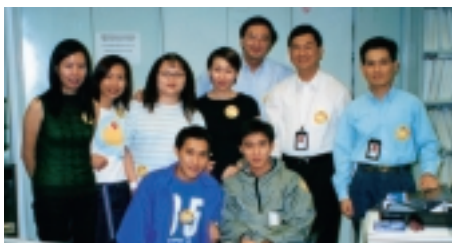
金管局職員參與一年一度的便服日活動，為公益金籌募善款。

年內，金管局職員繼續參與各項社群活動，其中包括組隊參加2000年2月20日舉行的渣打香港馬拉松賽。2000年4月10日，金管局與香港紅十字會安排舉行捐血日，吸引49名職員參加捐血的善舉。全年共有超過300名職員參加公益金及其他慈善或公共機構舉辦的籌款活動。