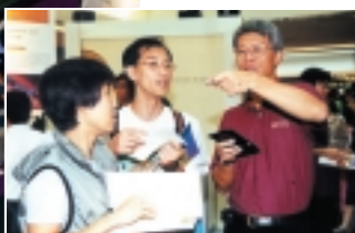
總裁任志剛先生向兩名參觀者講解鈔票的防偽特徵。

政策目標。展覽期間，金管局亦舉辦相關的講座，介紹本港硬幣鈔票的歷史及辨別偽鈔的方法。展覽現場由來自本港5間大學的學生大使，聯同金管局職員向參觀人士講解展覽內容。展覽吸引超過75,000名人士參觀。展覽結束後，金管局另於2001年1月至3月期間在各間大學及其他機構巡迴展出展覽的精萃，再吸引30,000名學