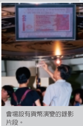
會場設有貨幣演變的錄影片段。