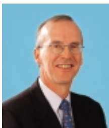
副總裁 簡達恆, JP

簡達恆先生負責所有銀行政策及監管的事務。簡達恆先生於1993年金管局成立時即出任現職。在此之前，簡達恆先生於1991年由英倫銀行借調至香港，出任銀行監理專員，負責銀行監管事務。