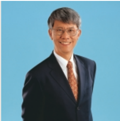
總裁 任志剛, JP

任先生於1993年4月金管局成立時即擔任總裁之職。任先生於1971年加入香港政府為統計主任，並於1976年調任經濟主任。在1982年，任先生獲任命為首席助理金融司，開始參與香港的貨幣與金融事務，並於1983年協助推行香港的聯繫匯率制度。任先生於1985年出任副金融司，再於1991年獲委任為外匯基金管理局局長。