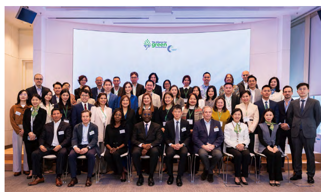
金管局、國際金融公司、成員銀行及知識合作夥伴一同參與Immersion Lab