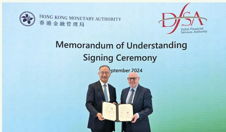
總裁余偉文先生(左)及迪拜金管局總裁莊思滔先生(右)在香港簽署並交換諒解備忘錄，以促進可持續金融領域合作

金管局於2023年12月與迪拜金融服務管理局(迪拜金管局)成立新合作夥伴關係，以支持促進中東和亞洲地區的氣候金融。此後，作為合作夥伴關係的其中一項重要舉措，金管局與迪拜金管局於2024年9月在香港合辦首屆聯合氣候金融會議。會議匯聚兩地來自不同背景、理念一致的參與者，交流意見及建立聯繫。在會議舉行期間，金管局與迪拜金管局簽署諒解備忘錄，進一步深化雙方在可持續金融領域的戰略合作關係，並將開展以可持續金融為主題的聯合研究項目，以促進知識共享。