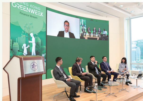
「亞太區氣候業務論壇」的專題討論環節