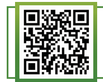
督導小組詳情載於相關網頁

督導小組亦透過跨界別技能培訓及數據提升，加強建設可持續金融生態圈。特別在數據方面，我們繼續推動採用督導小組於2022年與CDP合作推出的非上市公司氣候和環境風險問卷 2 。督導小組將繼續緊貼綠色和可持續金融領域的最新發展，並提升香港作為區內及全球綠色和可持續金融樞紐的地位。