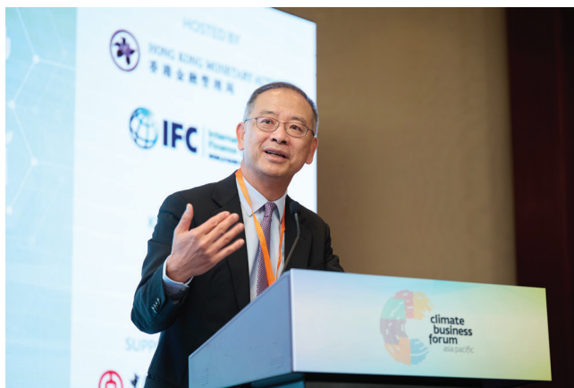
總裁余偉文先生在「香港綠色周」的焦點活動「亞太區氣候業務論壇」上致辭

區域合作亦同樣重要。除了我們與國際金融公司就「綠色商業銀行聯盟」長期合作外，金管局的基建融資促進辦公室亦在2023年加入了「可持續投資能力建設聯盟」及「綠色發展投融資合作夥伴關係」，成為創始成員。另外，「格拉斯哥淨零金融聯盟」亦宣布計劃在香港設立分部。透過這些合作關係，我們希望促進技能培訓及知識共享，繼而支持將資金引導至區內以至全球各地的可持續發展項目。為推動新業務發展及知識交流，金管局亦在今年較早前協助舉辦首屆「香港綠色周」，吸引共1,600多名來自近30個地區的嘉賓參與，當中包括全球商業及金融領域的頂尖決策者，共同討論擴大區內氣候融資的方案，並就此締結新的合作關係。