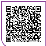
金管局向立法會財經事務委員會 簡報工作

此外，金管局代表不時出席立法會事務委員會及小組委員會會議，闡釋及商討特別事項，以及協助議員審閱條例草案。