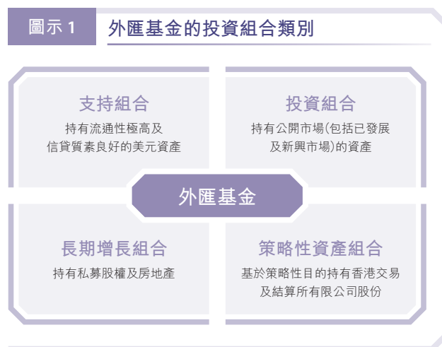
圖示 1 外匯基金的投資組合類別

外匯基金大致上分成兩個主要組合：支持組合及投資組合。支持組合持有流通性極高的美元資產，按照貨幣發行局制度的規定為貨幣基礎提供十足支持。投資組合主要投資於經濟合作與發展組織成員經濟體的債市及股市，以保障資產的價值及長期購買力。