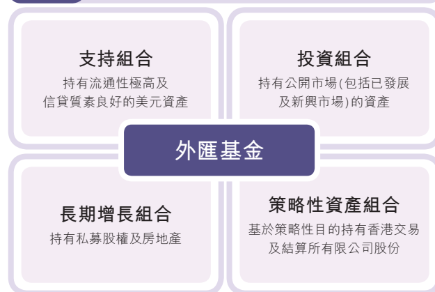
圖示1 外匯基金的投資組合類別

外匯基金大致上分成兩個主要組合：支持組合及投資組合。支持組合持有流通性極高的美元資產，按照貨幣發行局制度的規定為貨幣基礎提供十足支持。投資組合主要投資於經濟合作與發展組織成員經濟體的債市及股市，以保障資產的價值及長期購買力。