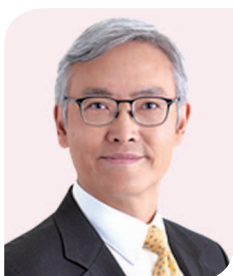
姚建華先生 , JP 保險業監管局 主席