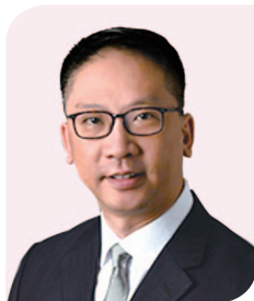
袁國強資深大律師 , 大紫荊勳賢, JP 大律師事務所