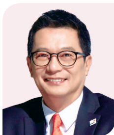
趙柏基先生 羅兵咸永道中國主席兼首席執行官 羅兵咸永道亞太主席