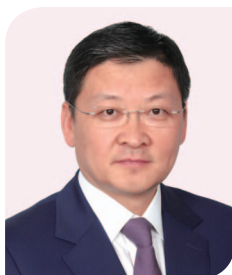
孫煜先生 中國銀行(香港)有限公司 副董事長兼總裁