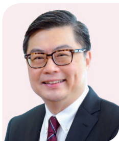
譚嘉因教授 , MH, JP 香港科技大學 工商管理學院院長及講座教授