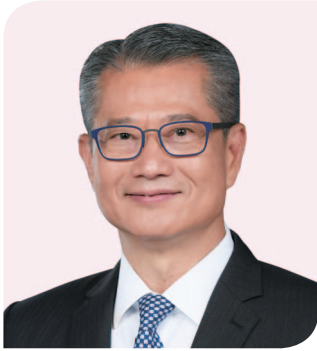
陳茂波先生, 大紫荊勳賢, GBS, MH, JP 財政司司長