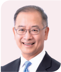
余偉文先生, JP 金融管理專員