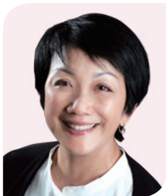
利蘊蓮女士 希慎興業有限公司 主席