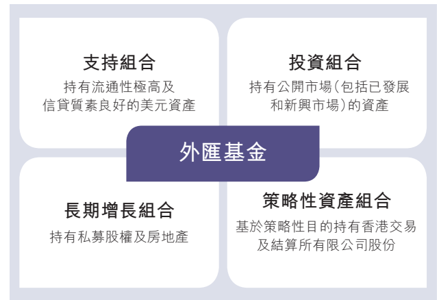
圖示1 外匯基金的投資組合類別

外匯基金大致上分成兩個主要組合：支持組合及投資組合。支持組合持有流通性極高的美元資產，按照貨幣發行局制度的規定為貨幣基礎提供十足支持。投資組合主要投資於經濟合作與發展組織成員國的債市及股市，以保障資產的價值及長期購買力。