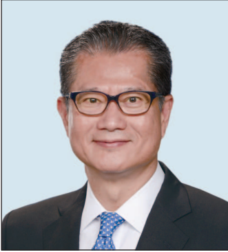
陳茂波先生, 大紫荊勳賢, GBS, MH, JP 財政司司長