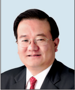
高迎欣先生 中國銀行(香港)有限公司 副董事長兼總裁 (任期由2018年2月20日起)