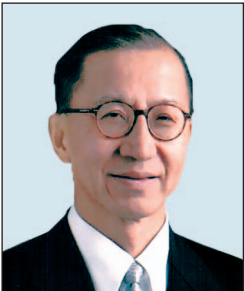
羅嘉瑞醫生 , GBS, JP 鷹君集團有限公司 主席兼董事總經理 (任期至2018年1月31日止)