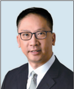
袁國強資深大律師 , 大紫荊勳賢, JP 大律師事務所 (任期由2018年9月1日起)