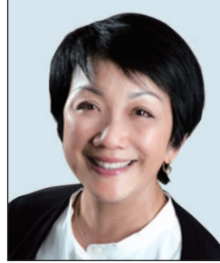
利蘊蓮女士 希慎興業有限公司 主席 (任期由2018年5月1日起)