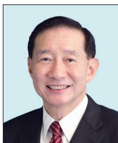
王冬勝先生, JP 香港上海滙豐銀行有限公司 副主席兼行政總裁