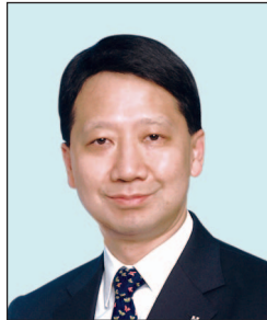
彭耀佳先生, SBS, JP 置地控股有限公司 總裁 (任期至2016年2月29日止)