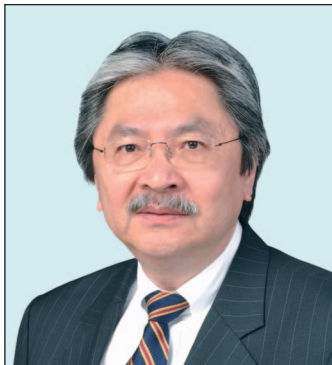
曾俊華先生, GBM, JP 財政司司長