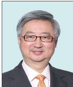
楊紹信先生, JP (任期由2015年9月1日起)