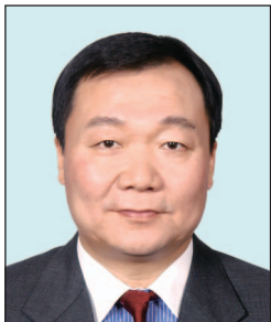
岳毅先生 中國銀行(香港)有限公司 副董事長兼總裁 (任期由2015年7月15日起)