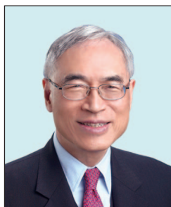
劉遵義教授, GBS, JP 香港中文大學藍饒富暨藍凱麗經濟學講座教授