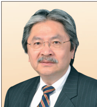
曾俊華先生, GBM, JP 財政司司長