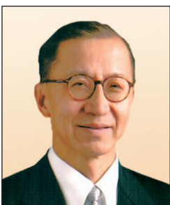
羅嘉瑞醫生, GBS, JP 鷹君集團有限公司 主席兼董事總經理