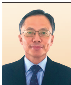
羅家駿先生, SBS, JP (任期由2014年7月18日起)