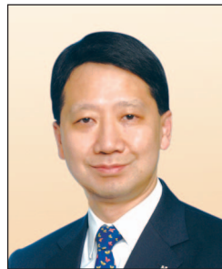
彭耀佳先生, SBS, JP 置地控股有限公司 總裁