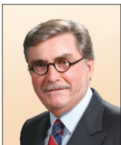
施文信先生, SBS, JP (任期由2014年2月1日起)