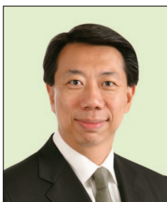
洪丕正先生, JP 渣打銀行(香港)有限公司 大中華地區行政總裁 香港執行董事及行政總裁