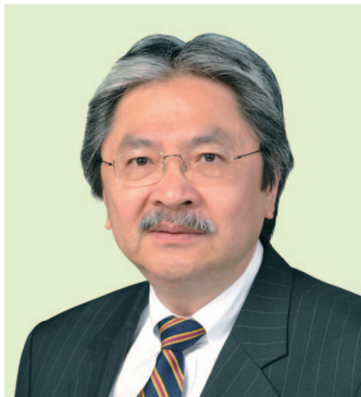
曾俊華先生, GBM, JP 財政司司長