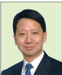
彭耀佳先生, SBS, JP 置地控股有限公司 總裁