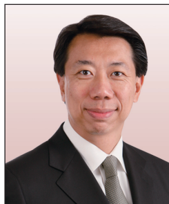
洪丕正先生, JP 渣打銀行(香港)有限公司 執行董事及行政總裁