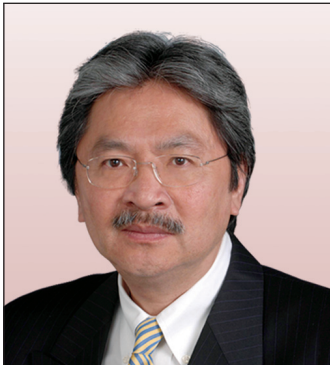
曾俊華先生, GBM, JP 財政司司長