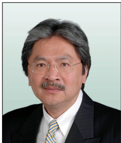
曾俊華先生, GBM, JP 財政司司長