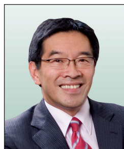
唐家成先生, JP 畢馬威亞太區及畢馬威中國 主席 (任期由2010年3月1日起)