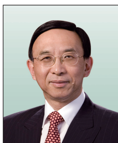
鄭海泉先生, GBS, JP 香港上海滙豐銀行有限公司 主席 (任期至2010年1月31日止)