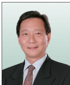
葉錫安先生, JP (任期至2010年4月30日止)