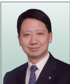
彭耀佳先生, SBS, JP 置地控股有限公司 總裁 (任期由2010年3月1日起)