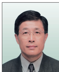
馮鈺斌博士, JP 永亨銀行有限公司 董事長兼行政總裁