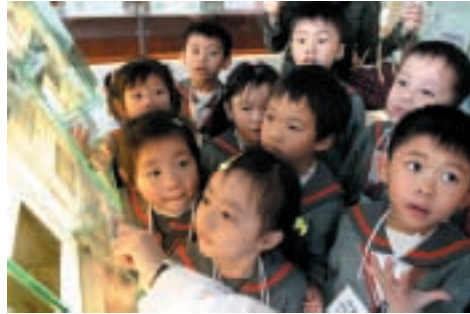
資訊中心是本港學校的熱門參觀地點之一。