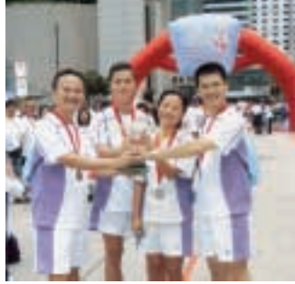
金管局代表隊在2005年地鐵競步賽中奪得第4名。