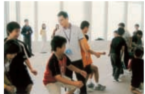
金管局義工為則仁中心的學生安排遊戲活動。

金管局一直支持物料循環再用，其中包括收集廢紙及使用過的打印機碳粉盒以供再造。此外，金管局又捐贈舊椅子予慈善團體，並定期舉行舊物回收運動，將同事捐出的舊衣物、玩具及其他可再用物品捐贈予慈善團體。