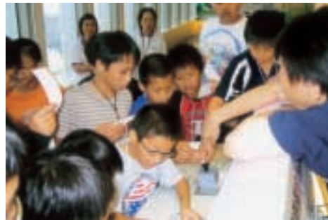
則仁中心的學生在2005年5月21日參觀金管局資訊中心。