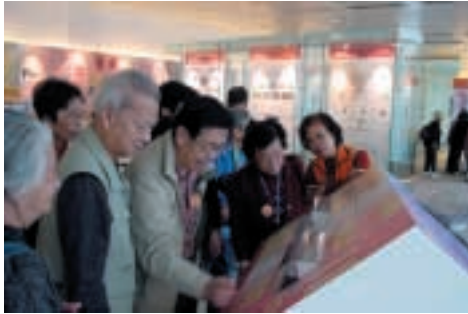
長者們對紙幣的防偽特徵大感興趣。