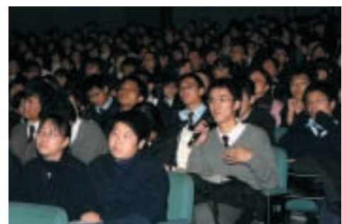
學生在金管局的公眾教育講座上發問。