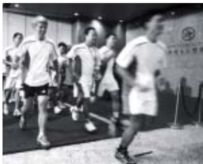
金管局代表隊參與決戰國金慈善跑。

此外，金管局從傷殘人士工場購置合適的辦公室用品，電子聖誕卡亦是由一個為視障人士提供服務的慈善團體所設計。