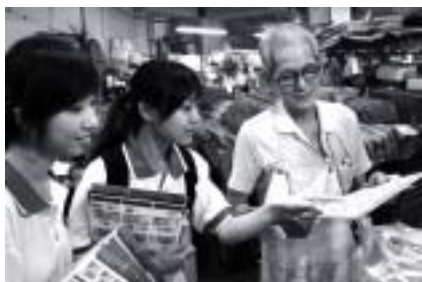
學生大使向零售商講解新鈔的防偽特徵。