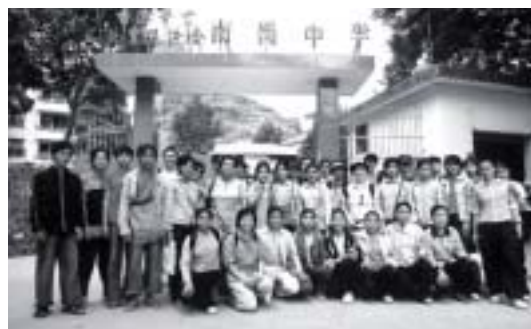
金管局義工小組探訪廣東省山區連南的學生。