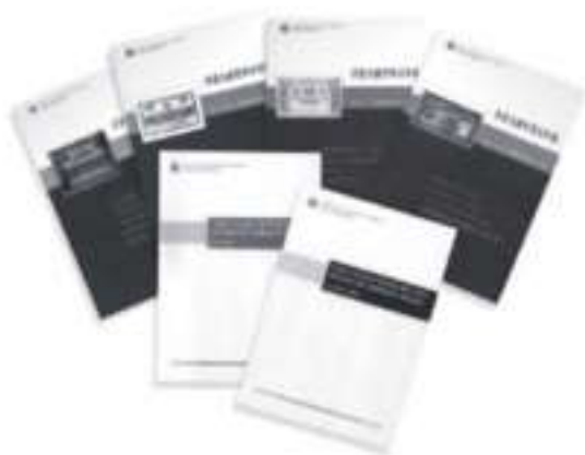
金管局在2004年出版的部分刊物。

金管局《二零零三年年報》(連同摘錄本及網上互動版本一併出版)在香港管理專業協會舉辦的最佳年報評選中獲得金獎。該年報以內容詳盡、形式簡明，以及自願披露有關機構管治的資料，獲得評判團讚賞。