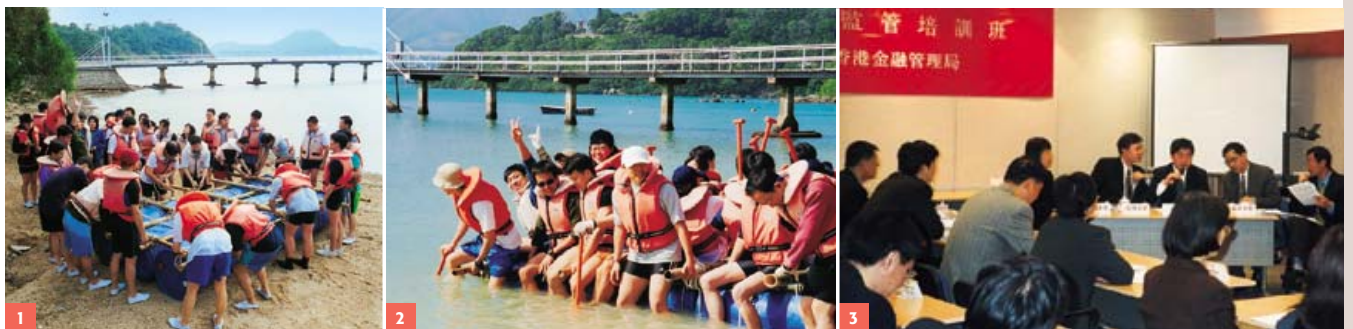
1-2 職員參加團隊合作培訓課程。