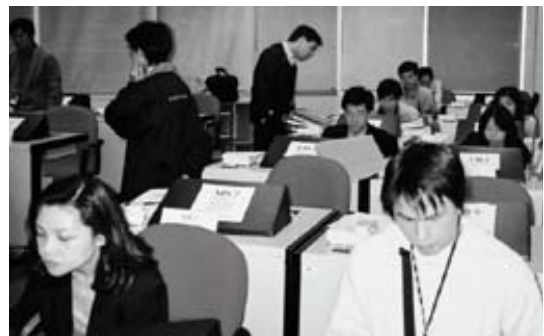
■ 在繼「九一一」事件舉行撤離辦事處的演習中，金管局職員利用後備設施繼續工作。

有關購置金管局長遠辦事處的商討於2001年完成。財政司司長法團與有關賣方簽署協議備忘錄，購置位於中環國際金融中心第2期的12層辦公室及兩層大堂，主要供金管局使用。