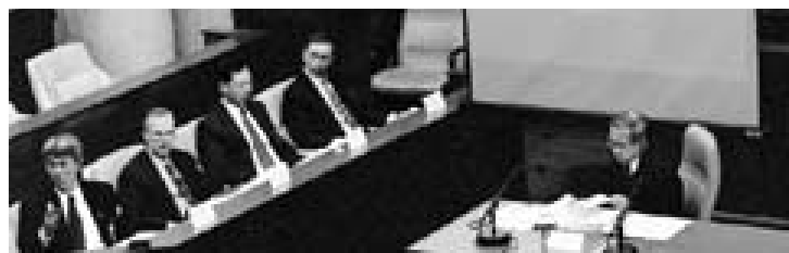
金管局高層人員向立法會財經事務委員會簡報金管局各項工作及政策。

在2001年，金管局繼續與立法會保持緊密聯繫。金管局每年3次向立法會財經事務委員會簡報金管局各項工作及政策，另外亦會按立法會要求，提交有關政策資料文件及出席簡報會。年內，金管局人員共出席45次立法會財經事務委員會及法案委員會的會議，就不同的課題進行商討，包括《銀行業(修訂)條例草案》、負資產問題及存款保險等。