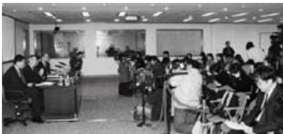
■ 新聞媒介是金管局與公眾溝通最常用及接觸面最廣泛的渠道。

金管局於年內為記者及編輯人員舉辦4次背景資料簡報會（2000年為3次），內容包括銀行業監理、銀行的證券業務與監管，以及香港債券市場的發展等。