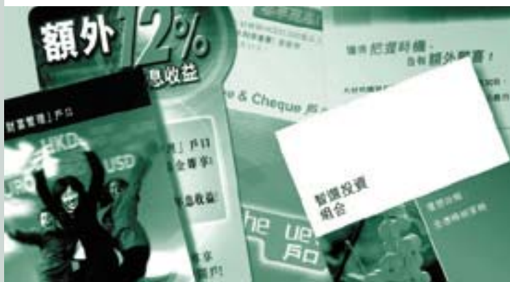
■ 銀行在撤銷利率管制後紛紛推出各項新產品。

面對撤銷管制的環境，若干銀行推出多項新產品，如綜合儲蓄及支票服務的戶口、與香港銀行同業拆息掛鈎的儲蓄產品等。有些銀行亦修訂各種收費及最低結餘額的規定，並引入利率分級制度。但由於這段期間銀行體系資金充裕，一般銀行無需積極招攬存戶，所以銀行之間並無出現資金大規模轉移的情況，存款息率亦無顯著上升。