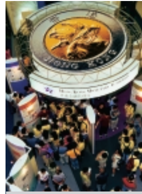
展覽於8月5日在九龍塘又一城舉行。