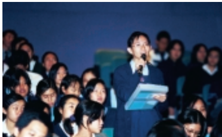
金管局在2000年舉辦8項教育研討會，吸引4,000多名中學生、教師及社區組織成員參加。