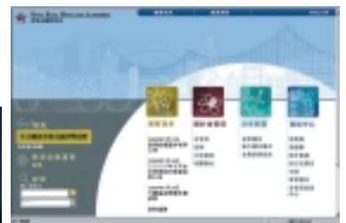
金管局於2000年7月推出全新設計的網頁。