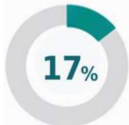
OTCC保證金抵押品總額中的佔比